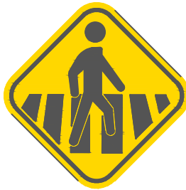
A-32b Passagem Sinalizada de Pedestres

SEM ESCALA TINTA: "TERMOPLÁSTICO EXTRUDADO"