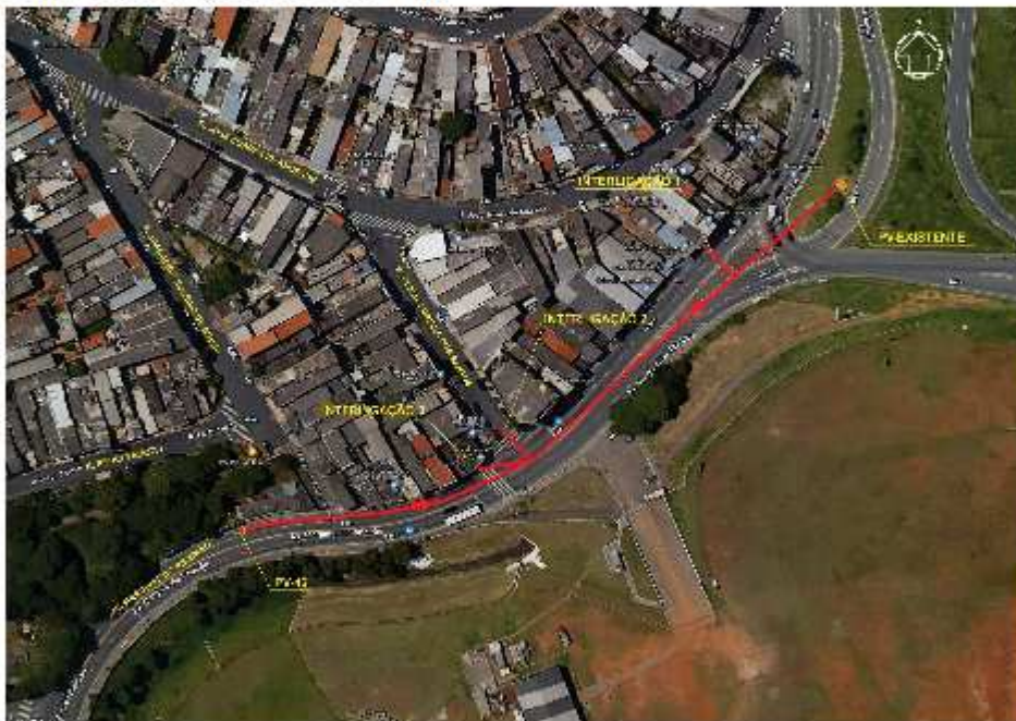
Croqui de localização do Coletor CT4:

Secretaria de Projetos Especiais, Convênios e Habitação