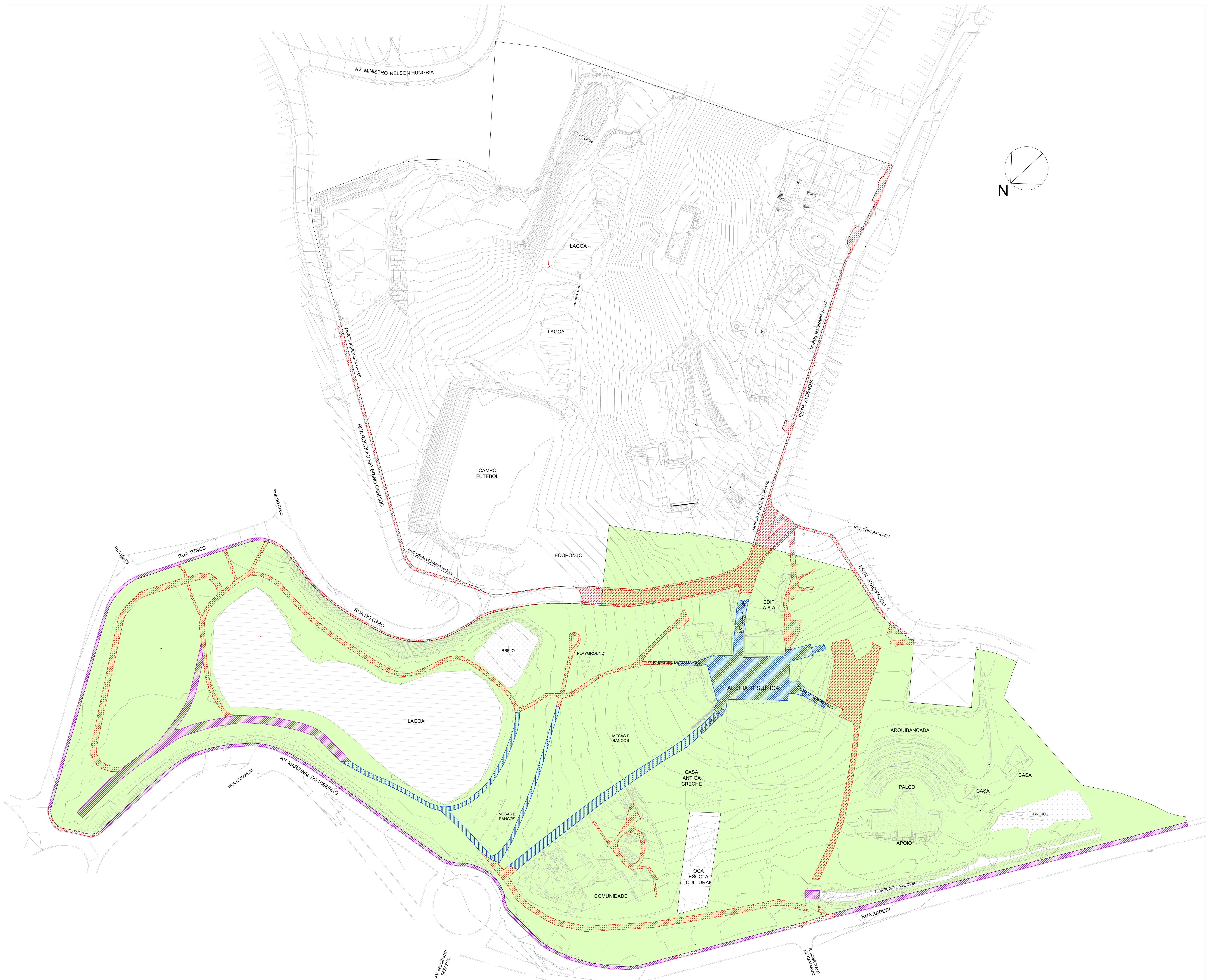
IMPLANTAÇÃO GERAL PAVIMENTAÇÕES - DEMOLIR, MANTER, REFORMAR escala 1 : 1.000